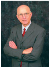
סגן שר ההגנה לשעבר, לורנס קורב