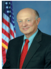
ראש הסי.אי.איי. לשעבר ג'י'מס וולטי