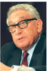
שר החוץ לשעבר של ארה"ב הנרי קיסינג'ר

100 מחברי בית המחוקקים של ניו יורק הצטרפו גם הם לקריאה לשחרור פולארד, וביניהם יו"ר בית הנבחרים של ניו יורק, שלדון סילבר. מצטרפים לבכירים האמריקנים שקראו לנשיא אובמה לשחרר את פולארד: